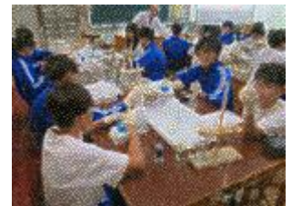
国立東京工業高等専門学校