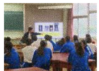
都立片倉高等学校