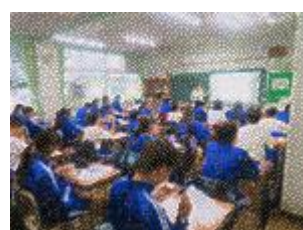
日本公認会計士協会