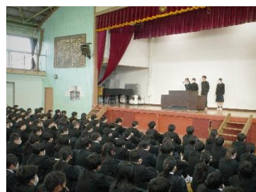
生徒会朝礼にて各委員長の活動報告

三学期の始業式で、全校生徒がそろって校歌を斉唱しました。今年度、1年生から3年生までが一堂に会して校歌を歌うのは、この日が最後となりました。3年生の指揮者：さん、ピアノ伴奏者：さんの役目も、ここで一区切りです。校歌に込められた思いとともに、先輩から後輩へと静かにバトンが渡された、心に残る始業式となりました。また、生徒会活動では、各委員会の委員長等が出席する中央委員会を実施しました。中央委員会は、ここ数年実施することができていませんでしたが、現生徒会役員を中心に準備を進め、今年度、実現することができました。会では、ベルマーク資金の使い道や他学年交流について意見交換が行われ、学校生活をよりよくしていこうとする生徒たちの前向きな姿が見られました。由井中学校が、今後さらに活気ある学校へと発展していくことを感じさせる取組となりました。