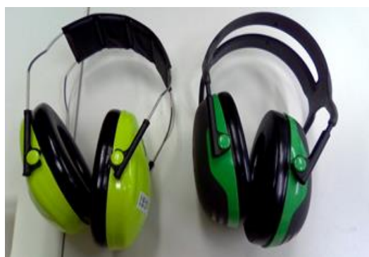
貸し出しているイヤーマフ

お子様が音の刺激に敏感で、日常生活で苦痛を感じているなどございましたら、イヤーマフを試すこともできますので、担任または保健室までご連絡ください。学校での様子等ご相談させていただき、お貸し出しいたします。