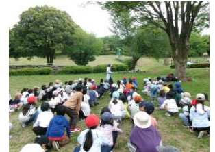
2年生遠足 富士見台公園

さて、令和7年3月31日まで、本校で御尽力くださった先生方から御挨拶をいただきました。子供たちは、離任された先生方に御礼のメッセージを渡します。離任された先生方には、これからも新しい場所で、子供たちのため、地域のために御活躍されることをお祈りしています。