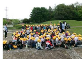
1年生遠足 番場公園

休み時間には元気に校庭で遊ぶ子供たちの姿が見られ活気にあふれています。子供たちにとって新しい学年での学校生活が始まり、早くも一月が過ぎるところです。新しい環境の中を過ごしてきた子供たちは、疲れが出てくる頃かもしれません。連休中はしっかりと休んで、元気を充電してほしいと思います。いよいよ今月末には、大きな学校行事である運動会を迎えます。子供たち一人一人が目標をもち、仲間と協力したり、自分の力を出し切ったりすることを通して、達成感を抱き、自分のよさや可能性を実感できるような教育活動を進めて参りたいと考えます。ぜひ、保護者・地域の皆様には、引き続き本校の教育活動へのご理解とご協力をいただけますようお願い申し上げます。