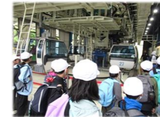
八ヶ岳移動教室(5年)