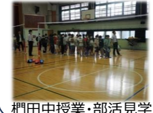
梶田中授業・部活見学