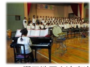
梶田地区交流音楽祭(動画による視聴)

梶田中学校グループ4校(梶田中・横山第一小・梶田小・緑が丘小)で連携し、小中一貫教育を推進しています。また、近隣保育園等と連携した交流を行っています。