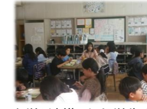
大学と連携した留学生交流