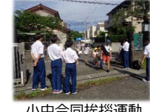
小中合同挨拶運動