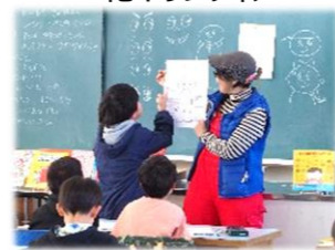
絵本作家出前授業