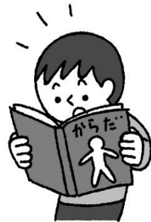
体について学びたいとき