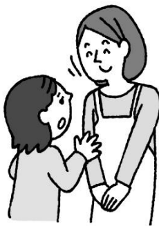
悩みや心配があるとき