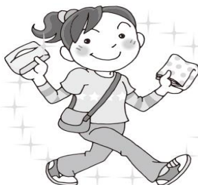
ハンカチとティッシュを持つ