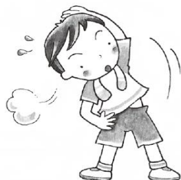
からだ うご 体を動かす