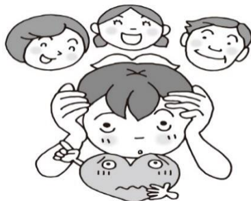
ひと はな 周りの人に話してみる