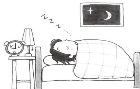
十分に睡眠を取ろう

*熱中症予防のため、体調や環境に合わせてむりなく汗をかいて、体を暑さに慣れさせて