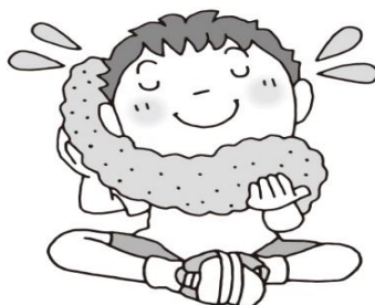
汗ふきタオルの用意をしよう