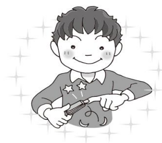
つめは短く切ろう