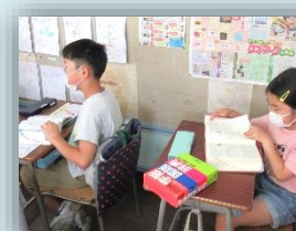
積極的な言語活動