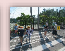
学校安全ボランティア