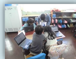
デジ・アナ双方の活用