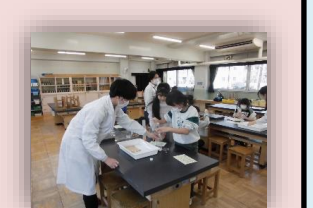
東京高専ワークショップ