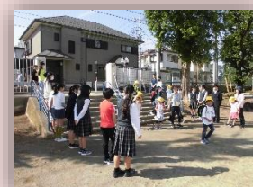
小中合同たて割り班活動