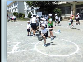
重点取組項目の設定