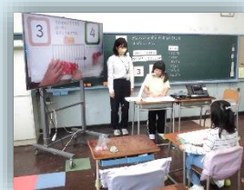
認知・身体を踏まえて