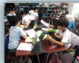
学習形態や方法を選ぶ