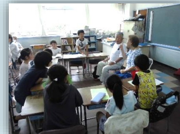
シニアクラブとの交流