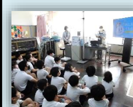
心身の健康維持 についての指導