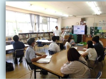
いじめ防止研修・特支教育研修