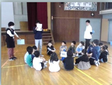
八王子盲学校との交流