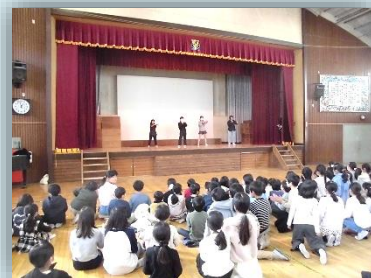
クラブ・委員会活動