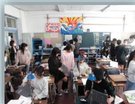
5・6年の社会・理科・国語などで実施（社会は横山中の教員も入っています）