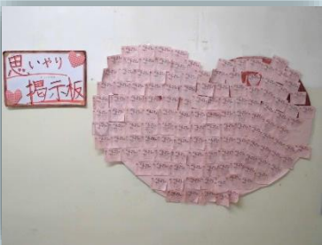
はちおうじっ子サミットの取組