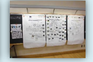
安全マップの制作