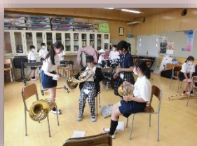
中学校授業・部活動体験