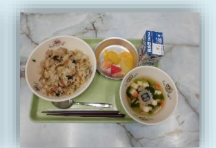
トピックメニュー についての学習