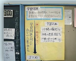
学習計画を立てる