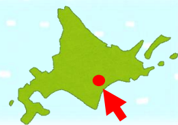
おびひろし 帯広市

豚丼が食文化として根付いている帯広市は、十勝地方の中心地であり、自然が豊かです。昔から豚の飼育も盛んで、豚丼の材料となる豚肉の生産もしています。