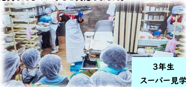
3年生 スーパー見学

どの学年も実際に体験することで、「見たい」「聞きたい」「知りたい」と自らすすんで学習することができました。教育活動は、学校だけでなく地域のお力で、充実したものになると実感しました。