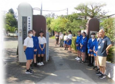
梶田地区ふれあい活動 (あいさつ運動) (6/22)