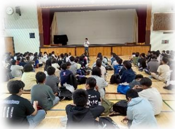
6年生 中学校見学の様子 (6/8)

夏休みを目前に控え、1学期のまとめの時期を迎えます。子供たちがこれまでの歩みを振り返り、自信をもって次のステップへ進めるよう、教職員一同、最後まで丁寧な指導に努めてまいります。今後とも変わらぬご支援とご協力をよろしくお願いいたします。