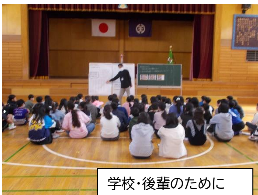
学校・後輩のために 貢献した新・6年生！