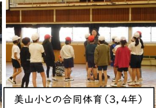
美山小との合同体育(3,4年)