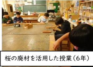
桜の廃材を活用した授業(6年)