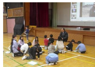
町会ごとに話を聞く3年生

「社会に開かれた九小」ということで、保護者・地域の方々との大切な行事もあります。第1に、町会の「どんど焼き」です。12月19日に3年生が、西一・西二・西三・東四町会の方々から、どんど焼きについての説明を受けたりインタビューに答えていただいたり総合的な学習の時間として学びました。そして、3年生は、12月25日の終業式で全校に向けて、各町会の開催日時・集合場所・持ち物などをしっかりと発表しました。「地域のつながり」のための大切な行事にぜひご家族で参加していただけたらと思います。日程・場所は裏面をご確認ください。