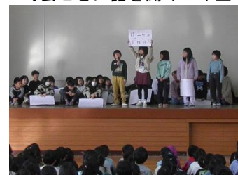
2学期終業式で発表する3年生

第2に、1月17日(土)学校公開・道徳授業地区公開講座です。道徳授業地区公開講座は、学校、家庭、地域が一体となって子どもたちの豊かな心を育むとともに、道徳教育の充実を図ることを目的としています。詳細は、追って連絡いたしますので、ぜひ、今年度のまとめの学校公開にご参観いただけるようよろしくお願いいたします。