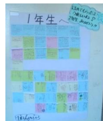
感想カードの掲示

学習発表会は、このように子どもたちの成長や学びが随所に感じられる有意義な行事になりました。そして、学年を超えて、感想を届け、伝え合いが行われることも大きな醍醐味です。下の学年からは憧れの言葉、上の学年からは下の学年が分かる言葉を選ぶという実のある言語活動が行われていることがすばらしいです。たくさんの保護者・地域の方々にご参観いただいたおかげです。ありがとうございました。