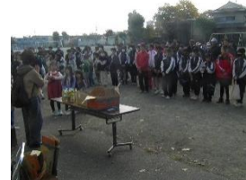
クリーンデー閉会式

また、11月15日（土）には青少対のクリーンデーが行われ、九小・二中の子どもたち、保護者・地域の方々の総勢170名が集まり、地域の清掃に取り組みました。たくさんのゴミが集められ、クリーンな環境・気持ちになり、みんなでクリーンな九小地域にしていこうという気持ちを高めることができ、うれしく思いました。