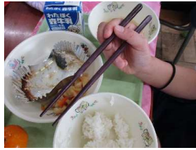
＼正しくはしが持てるよ！／

給食の様子を見に行くと、豆を上手につかんで見せてくれたり、おはしの正しい持ち方を披露してくれるなど、はしづかいを意識して食べている児童が多かったです。