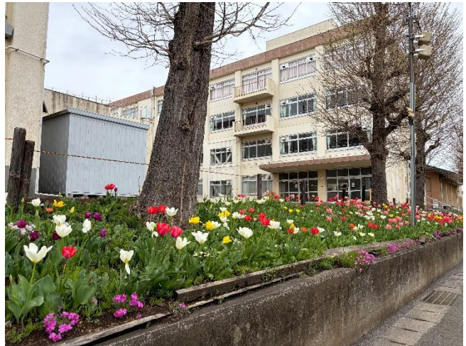
今年度も美しく咲きそろいました。美化ボランティアの方々と生徒有志による伝統の春の草花の開花です。

さて、新入生の皆さん。本校では、近隣の小学校と一緒に、さまざまな取組を行い、児童・生徒の小中合同・一体化を推し進めてきました。具体的には、小中合同あいさつ運動、合唱コンクールでの小中合同合唱、生徒代表による小学校運動会閉会式でのあいさつ及び激励、そして、今年度からは、小学校6年生の学校部活動見学会及び防災を考える小中キャリア教育を始めることなどが計画されております。新入生の皆さん、第七中学校に入学後、今度は皆さんが近隣の小学校の児童に対し、小中合同・一体化を、あいまいではなく実際に積み重ねていく、いわゆる実装することができるよう、一緒にがんばりましょう。