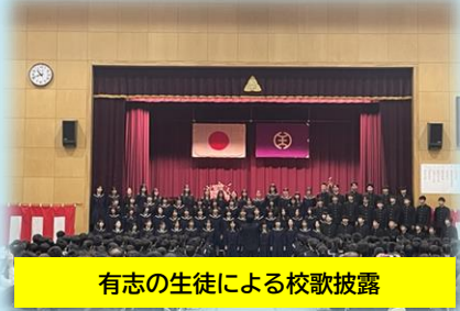
有志の生徒による校歌披露

令和8年4月8日(水)の入学式の中で、在校生有志による第五中学校の校歌紹介がありました。有志は2年生、3年生から総勢80名を超える生徒が集まってくれました。先生方の呼びかけで、多くの生徒が新入生のために集まり校歌を披露する伝統が、今年も紡がれました。