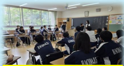
学級目標について話し合うの場面

令和8年4月15日(水)に第3学年の各学級で、前期学級目標決めを行いました。写真は学級内で話し合っている場面です。令和8年度の教育課程では、令和7年度に引き続き生徒が主体的に、当事者意識をもって考えたり、物事を決定したりできるよう、教師がファシリテーター役となって取り組みます。合議というプロセスを経て決定した学級目標を生徒一人ひとりが意識をして達成できるように取り組んで欲しいと思います。