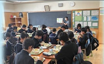
栄養士による食育講話の場面

令和8年4月22日(水)に給食センター元横山から3名の栄養士さんが来校され、第1学年の全ての学級で「食育」の講話をしていただきました。今回は、「中学生にとって必要な食事とその量について」、分かりやすい資料を使って、説明をしてくださいました。