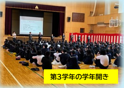
第3学年の学年開き