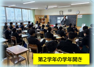
第2学年の学年開き

新たな気持ちと、前向きな気持ちをもって、新年度の個人の目標を実現して欲しいと願っています。