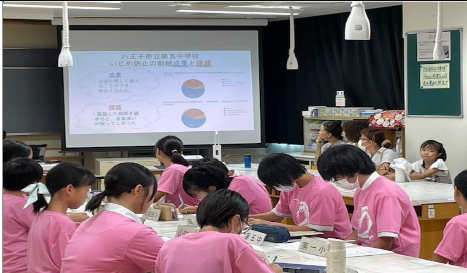
はちおうじっ子サミットの様子です。いじめ防止について話し合いました。