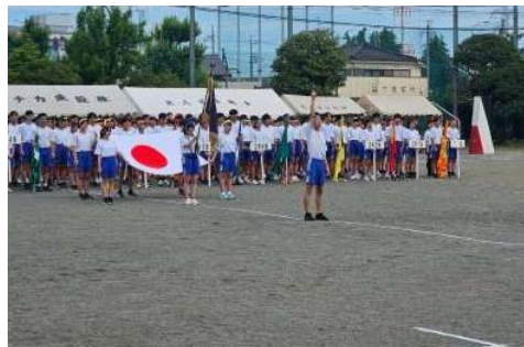
今年度の体育大会開会式(本校校庭にて)