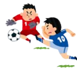
○地域団体の活動紹介