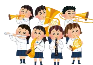
○イベントカレンダー