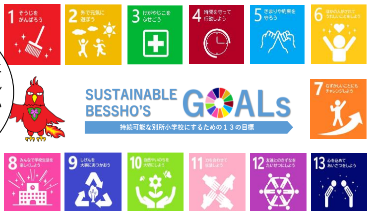
本校キャラクター：フェニックスくん

左図は、令和3年度に30周年記念として子どもたちが作成したSBGsです。本校がよりよい学校としていつまでも持続していくための13のポイントが書かれています。今年度も意識して取り組んでいきます。